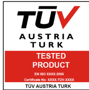
TÜV AUSTRIA TURK TESTED PRODUCT