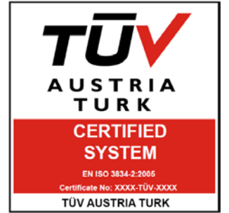
TÜV AUSTRIA TURK CERTIFIED SYSTEM