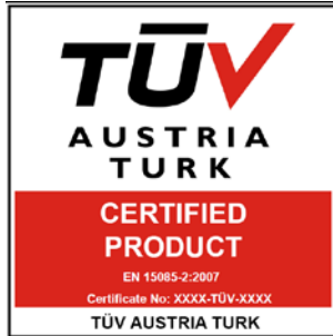
TÜV AUSTRIA TURK CERTIFIED SERVICES