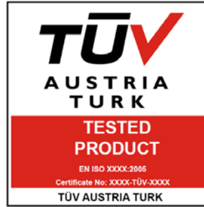
TÜV AUSTRIA TURK TESTED PRODUCT