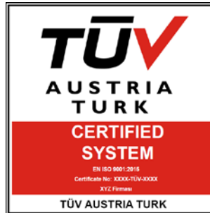
TÜV AUSTRIA TURK CERTIFIED SYSTEM